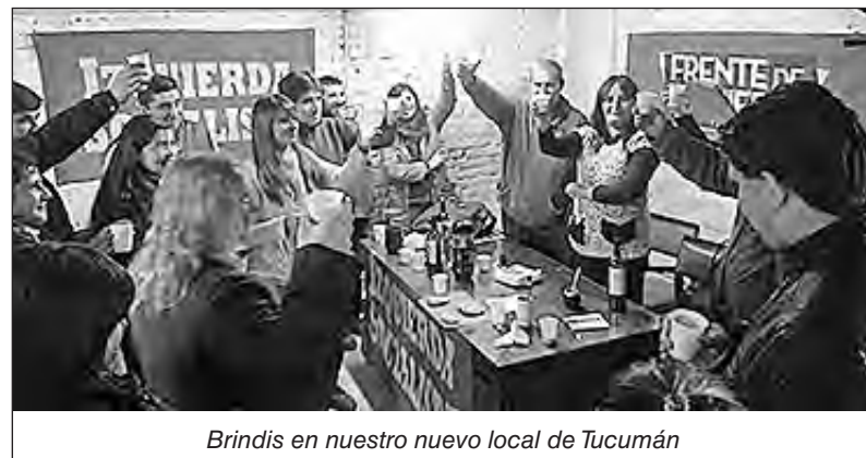
Brindis en nuestro nuevo local de Tucumán

Unas ricas empanadas y un emotivo brindis pusieron fin a la exitosa jornada tucumana. Saludando a todos aquellos que nos acompañaron a poner de pie a nuestro partido en esa importante provincia para seguir desarrollando nuestro trabajo político en el norte del país.