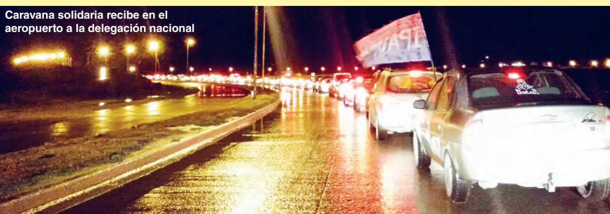
Caravana solidaria recibe en el aeropuerto a la delegación nacional

Llamamos a redoblar la campaña de solidaridad con esta lucha heroica contra el ajuste nacional y provincial y por el cese de la persecución a todos los luchadores y dirigentes de la Unión de Gremios fueguinos.