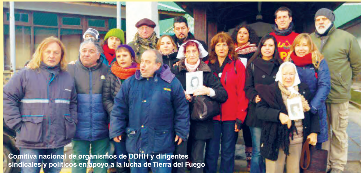
Comitiva nacional de organismos de DDHH y dirigentes sindicales y políticos en apoyo a la lucha de Tierra del Fuego