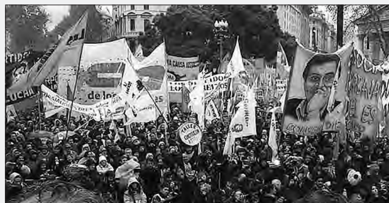
Vista de la Plaza de Mayo en el acto de las CTA