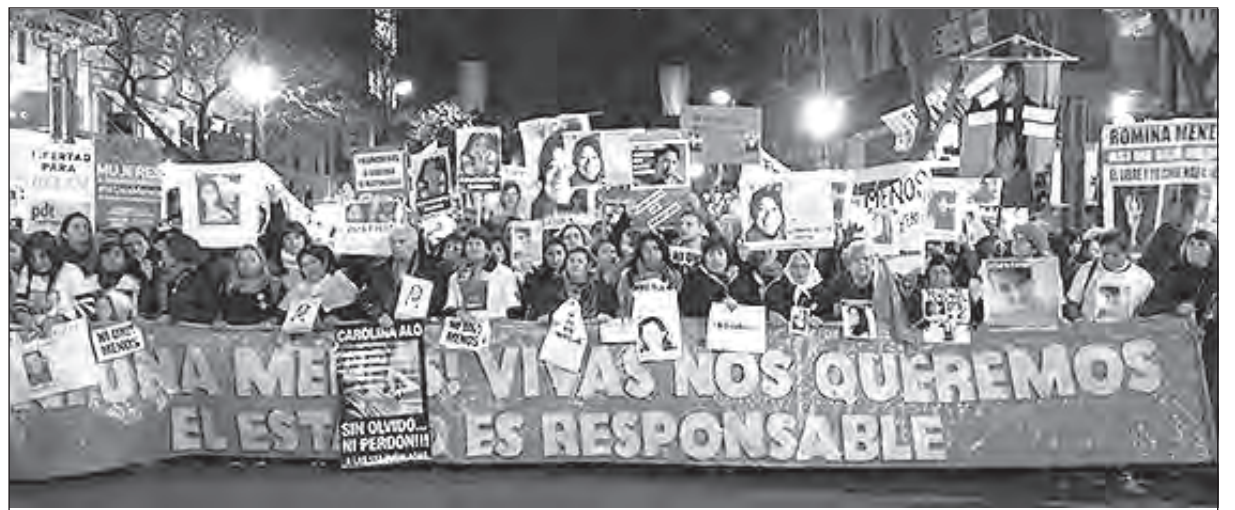
Cabecera de la marcha en Buenos Aires

En 2015, la indignación popular ante la magnitud de los femicidios fue canalizada por la propuesta de un grupo de periodistas mujeres de los distintos medios de comunicación que convocaron durante más de un mes a la concentración en Plaza Congreso y en las distintas plazas del país donde se leyó un documento