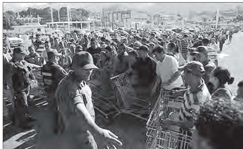
Largas colas de venezolanos para conseguir unos pocos productos básicos

En ese sentido, la iniciativa del Encuentro del Pueblo en Lucha y el Chavismo Crítico, planteada por Marea Socialista, SintraUCV,