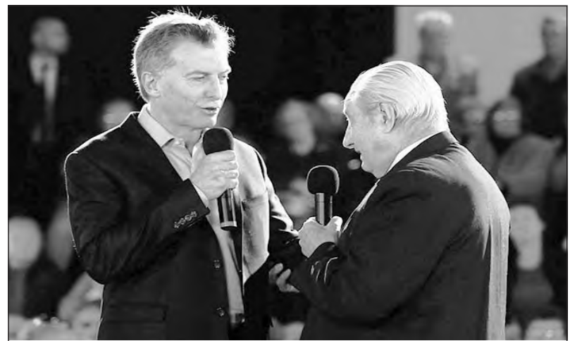
El anuncio de Macri es una vulgar mentira

Macri usa este anuncio para "posar" que está con los más humildes y lavarle la cara a su brutal ajuste. Tanto Massa como el Frente para la Victoria van a apoyar el paquetazo de ley de Macri "con retoques parciales". Nosotros exigimos el pago del 100% de toda la deuda sin quitas ni cuotas para todos los jubilados. Un aumento de $6.000 de emergencia para todos, junto con el reconocimiento del 82% móvil del salario en actividad. Todo esto debe ser financiado por el Tesoro Nacional en base a la suspensión inmediata de los pagos de la deuda externa y un fuerte impuesto a banqueros, multinacionales, grandes empresarios y terratenientes.