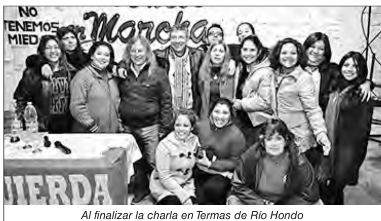
Al finalizar la charla en Termas de Río Hondo

Muchos de los tantos compañeros que hicieron uso de la palabra señalaron: "Nos vinieron jodiendo con Alfonsín, Menem,