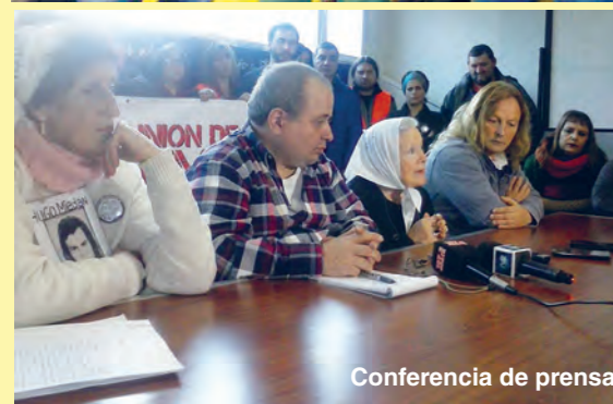
Conferencia de prensa